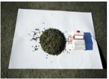
再生原料(ペレット)

前工程を終えたプラは加熱し粒状に加工してプラの再生原料としてメーカーに販売します。